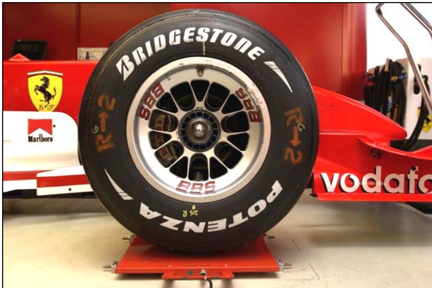
Desde F1 a Formula 3 y GT